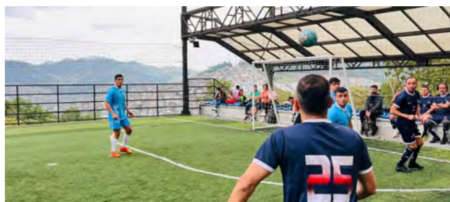
Fútbol 5 masculino: Canchas sintéticas Goles, Universidad Católica, Centro Recreacional Santágueda y La Uribe.