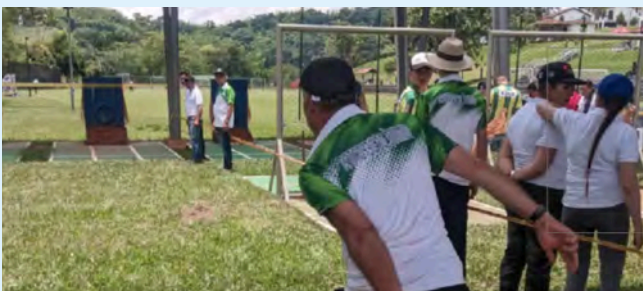
Tejo masculino - Minitejo femenino: Centro Recreacional Santágueda, El Encuentro Bajo Tablazo.