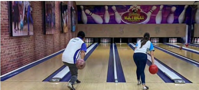
Bolos mixto: Bowlera Multibolo, Multicentro Estrella.