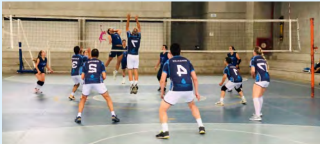
Voleibol mixto: LANS, Universidad de Caldas, Centro Recreacional Santágueda, San Luis y escenarios públicos .